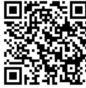
Termine bewegliche Ferientage

Am letzten Schultag vor den Ferien endet der Unterricht für alle Kinder immer nach der dritten Unterrichtsstunde um 10.30 Uhr. Das gilt auch für den Tag, an dem die Halbjahreszeugnisse ausgegeben werden.